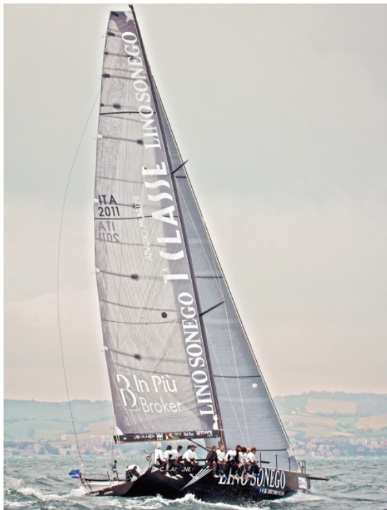
PRESTIGIO Per il Circolo Canottieri Aniene una partecipazione di prestigio alla Rolex Fastnet Race

Tra gli iscritti in questa prossima edizione anche Dona Bertarelli sul fiammante multiscalo appena varato Spindrift 2, il Mod 70 Oman Air che corre con i colori del sultanato, avversario diretto di Edmond de Rothschild, Mod 70 francese di Cyril Dardashti.